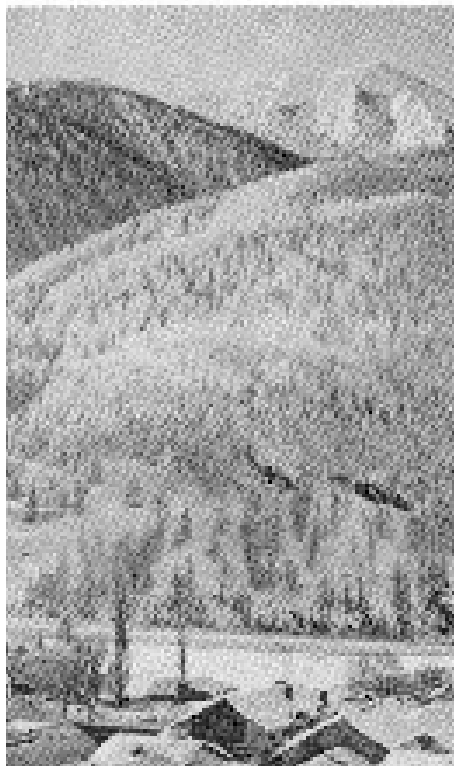
Une belle forêt de mélèzes

Et le roi des arbres du Queyras est le mélèze qui compose les 2/3 des forêts.