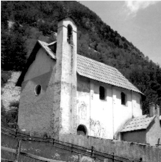
L'église du hameau du Veyer-; chaque hameau a sa chapelle