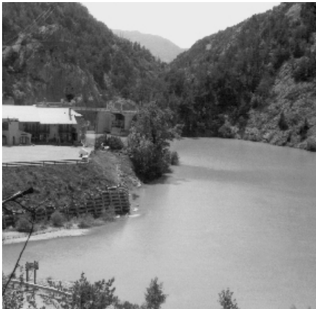
La maison du roi et le barrage