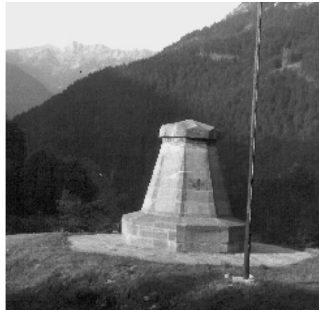
Le monument aux morts du Queyras au rocher de l'Ange gardien

└─La Maison du Roi, au milieu des gorges du Guil, à l'embranchement de la route de Ceillac, est, depuis 1981, au bord d'un lac barrage de faible dimension et de forte chute. Son nom vient de ce qu'un privilège royal dispensait d'impôts les propriétaires contre l'obligation de recevoir et de conduire les voyageurs dans les temps de tourmente. Un tableau dans l'auberge rappelle ce privilège. Louis XIII, se rendant en Italie, en 1629, se serait arrêté là-; on lui aurait servi une omelette. Trouvant les œufs bien chers il aurait fait la réflexion: "Les œufs sont donc bien rares dans votre pays". Sur quoi il lui aurait été répondu: "ce ne sont pas les œufs qui sont rares... C'est votre Majesté".