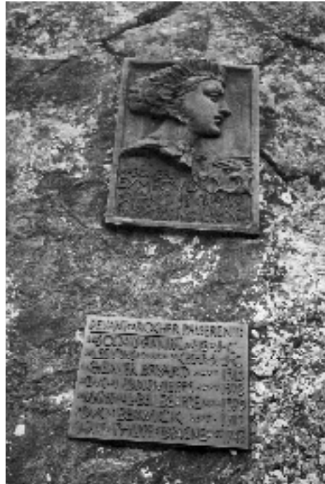
Plaque commémorative (Fontgillarde). Villevieille s'enorgueillit d'une auberge qui a pour enseigne un éléphant; suivant l'opinion des habitants, cette enseigne prouve qu'Annibal a traversé le Guil.

Cette traversée des Alpes, racontée par Polybe et Tite Live, se fit fin octobre-début novembre ("au coucher des pléiades"). Il fallut, depuis le Rhône, 213 km de marche en 10 jours mêlés de durs combats.