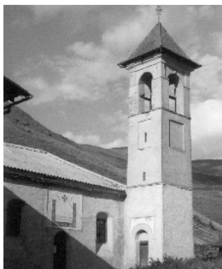
cadran solaire au temple de Fontgillarde.