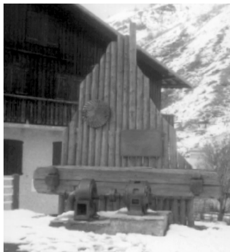
Le monument à l'Electricité.