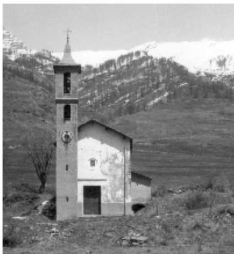
L'église de la Monta; l'un des seuls bâtiments ayant survécu à l'incendie de 1944.