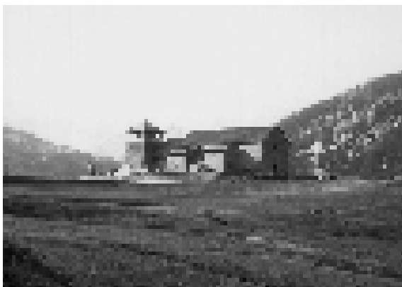
L'église de Molines avec son clocher arraché par la tourmente en 1982 puis restauré. Cette église Saint-Romain eut à souffrir des guerres de religion en 1574 et fut reconstruite entre 1628 et 1637