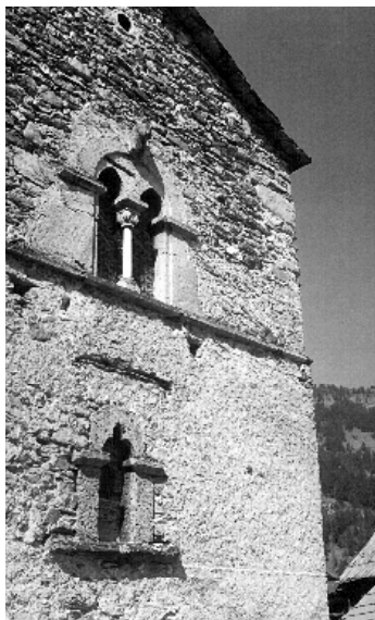
Fenêtre geminée du Moyen Age au hameau de la Rua, fin XV e