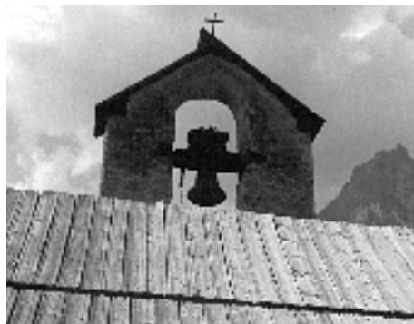
Chapelle à Bramousse

Les condoléances sont exprimées, comme partout, avec plus ou moins de sincérité. La formule consacrée à cet effet est celle-ci-: Dio gardé aquous qué restoum, dit le visiteur en entrant dans la maison du défunt. On lui répond-: Dio garde li vouestré. Dieu garde ceux qui restent. Dieu garde les vôtres.