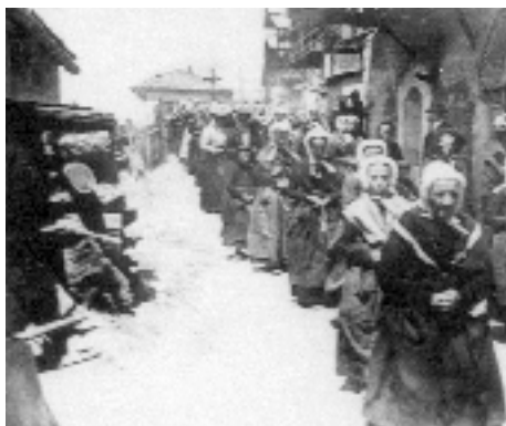
Procession dans les rues de Saint-Véran vers 1910.

Extraits de "Mœurs et coutumes du Queyras" Abbé Gondret, 1858.