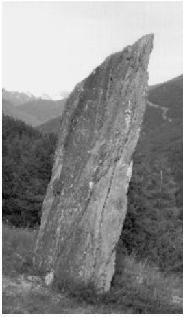
La pierre fiche à 45 minutes de marche sur le sentier des astragales brisée en 1852 parce qu'on crut trouver un trésor à sa base.