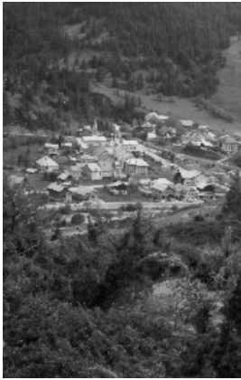
Le village de Villevieille quelque 40 ans après les inondations de 1957