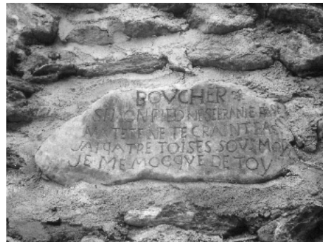
Inscription de 1768 après la grande inondation de 1733 (pour conjurer le sort)