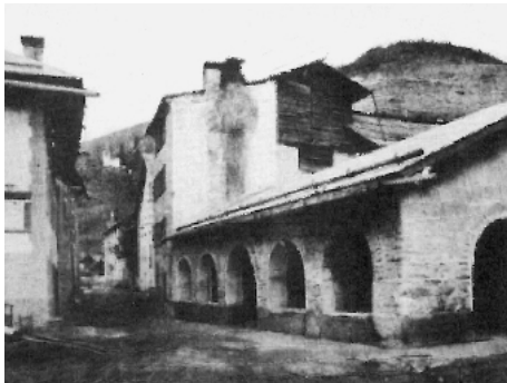
La halle d'Abriès jusqu'en 1850-; autrefois centre du commerce du Queyras