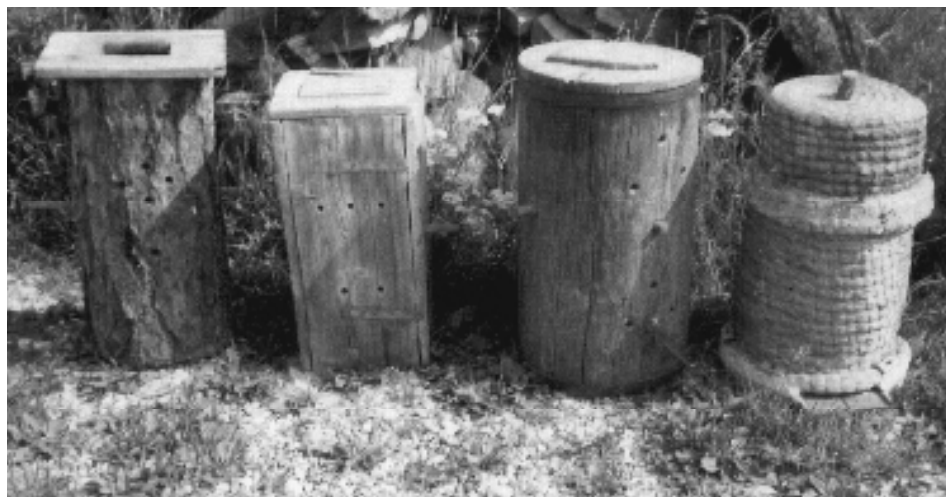
Quatre ruches anciennes- de la fin du XIXème siècle (entre 1880 et 1900)--; miellerie du Haut queyras à Molines