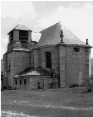
L'église non achevée