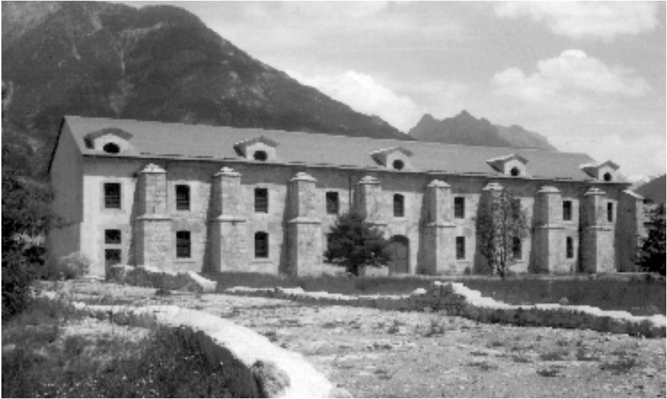
L'arsenal et les ruines de son aile bombardée en 1940