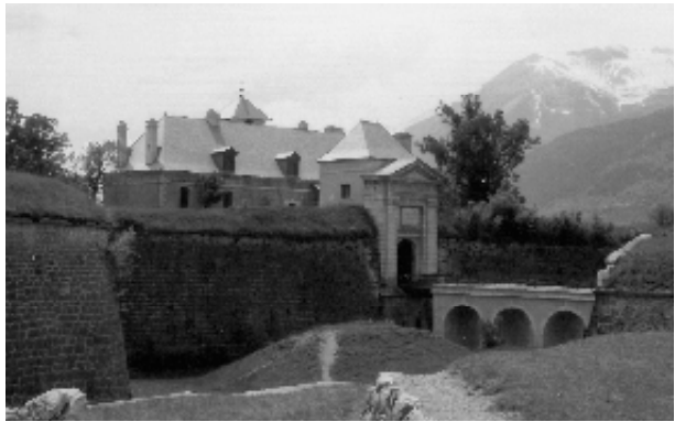
La porte d'Eygliers au Nord